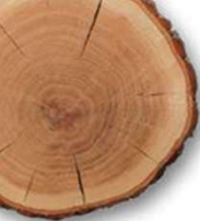
PLANCHE RABOTEE ROBINIER (faux-acacia)